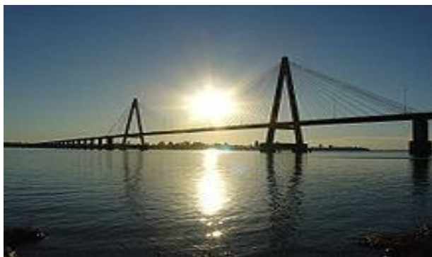
El conocido puente Internacional, que une a Encarnación con Posadas, Argentina.

Se puede acceder al Departamento de Itapúa por vía terrestre a través de las siguientes rutas: