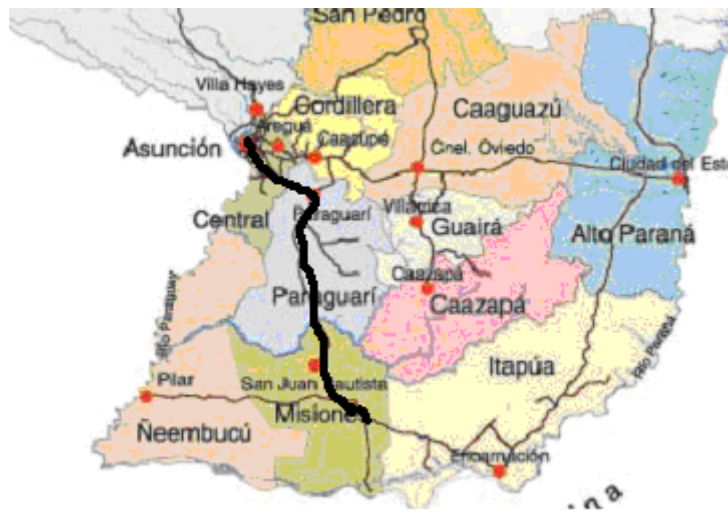
Figura 3. Área de Influencia indirecta.